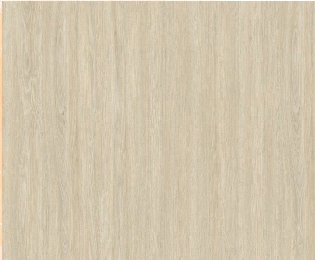
V590WT COUP DE Foudre / LOVE AT FIRST SIGHT