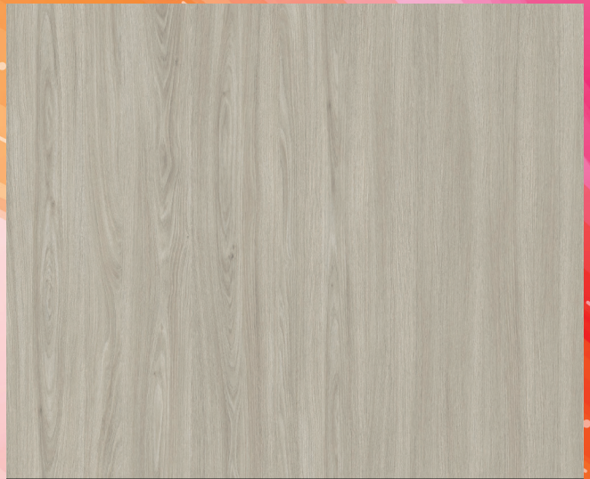
V593WT ÉMINENCE GRISE / MASTERMIND