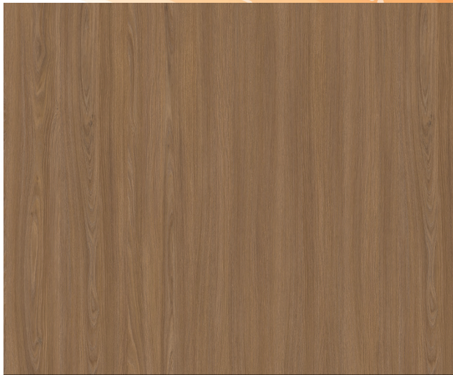
V592WT ACCROCHE-CŒUR / KISS CURL