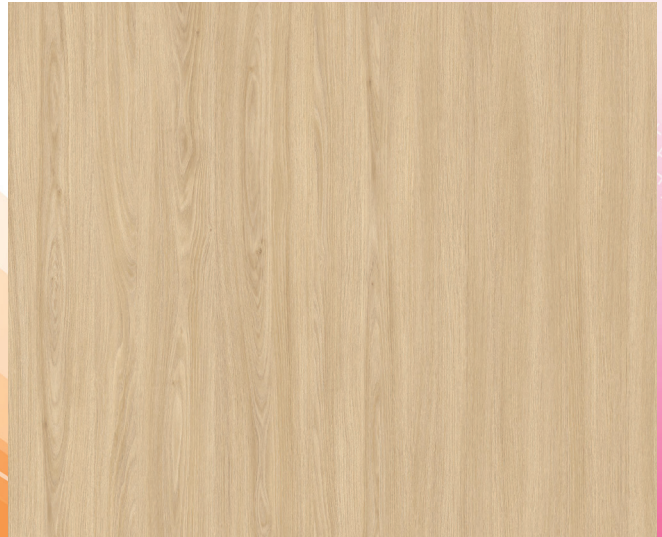
V591WT MIEL D'ACACIA / ACACIA HONEY